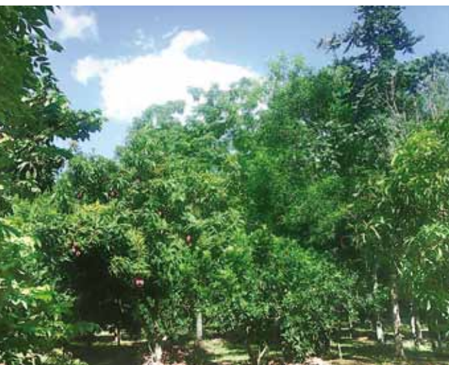
Paraguay Parent Tree Mischwald, sieben Jahre alt