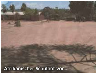
Afrikanischer Schulhof vor...