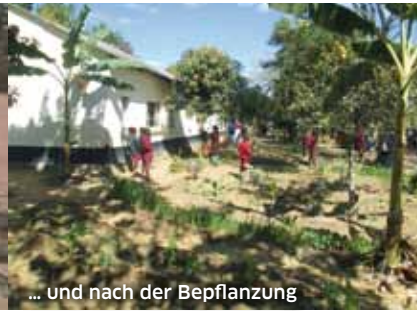
... und nach der Bepflanzung