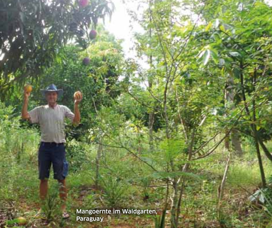
Mangoernte im Waldgarten, Paraguay