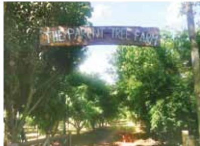
Paraguay Parent Tree Farm

Lius Film: „Sie wollen, dass wir überall Bäume pflanzen, sogar im guten Land.“ Doch schließlich beteiligten sie sich an dem großen Werk. Inzwischen ist eine Fläche von der Größe Belgiens wieder grün und fruchtbar geworden.