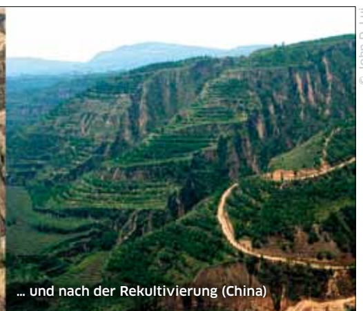
... und nach der Rekultivierung (China)